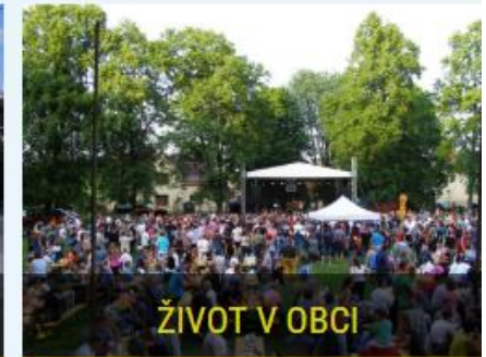
ŽIVOT V OBCI